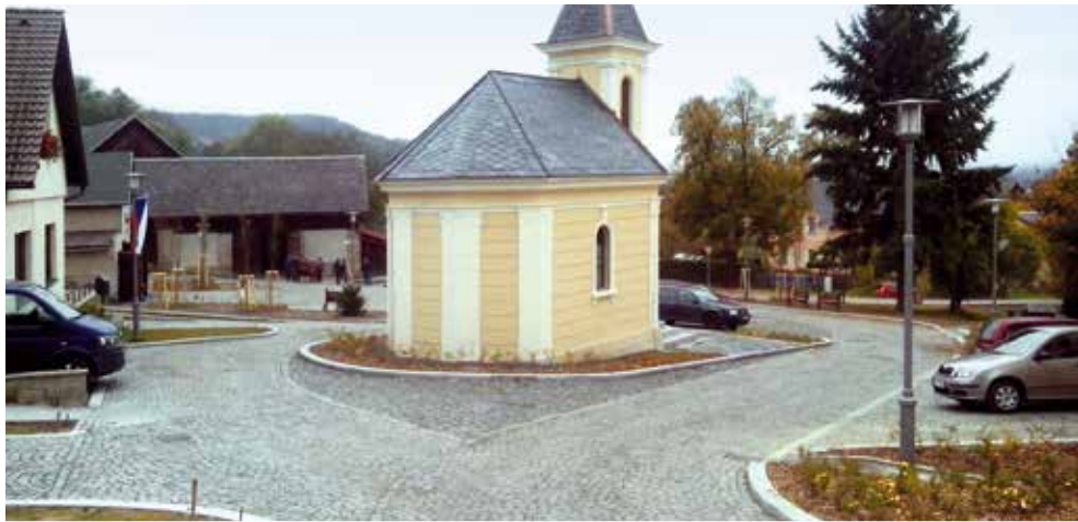
Rekonstrukce návsi v Mašově

přístupu k zastávkám BUS Lestkov“, která zahrnovala vybudování odvodnění, dvou autobusových zálivů, vybudování chodníků z betonové zámkové dlažby, zárubní zídky ze zdících bloků, realizaci veřejného osvětlení, obnovu povrchu komunikace s asfaltovým krytem, realizaci svislého a vodorovného značení a dodávku mobiliáře. V polovině roku byla zahájena stavební činnost na zakázce pro obnovu zpevněných ploch na návsi v Mašově. Stavba zahrnovala vybudování nové dešťové kanalizace, přeložku kabelového vedení spol. Telefonica O2, vybudování nového veřejného osvětlení, vybudování nových konstrukčních vrstev vozovek s krytem z kamenné drobné kostky, chodníků z mozaikové dlažby a výrobu a dodávku mobiliáře.