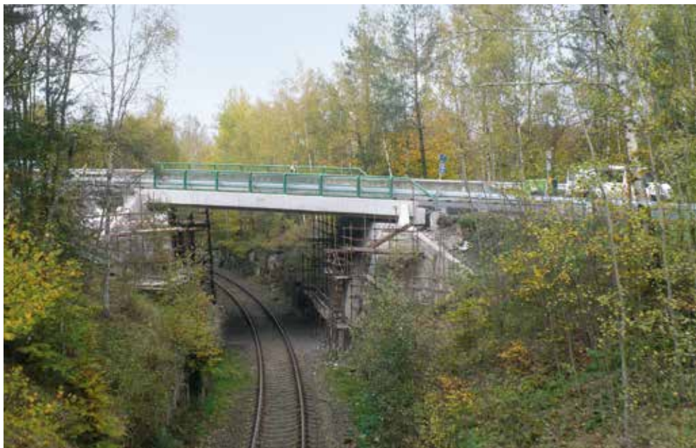
Rekonstrukce mostu ve Svoru

sezónu z minulého roku i závodu v Hradci Králové. Také v zakázkách pro SŽDC, resp. pro investory v této oblasti stavebnictví, se podařilo umístit českolipské a nově také i děčínské kapacity. Také naše provozy elektro a ocelářů přispěly k zlepšení tržeb a přidané hodnoty. Na druhou stranu se bohužel stále nedaří dostat na úroveň rentability závod v Český Budějovicích. V průběhu sezóny jsme také očekávali větší přínos od provozu obalovny a pokládky. Konec roku ale ještě může tento výsledek pozitivně zvrátit. Vždyť například poptávka po pokládce asfaltových směsí je obvykle vystupňována až v posledních měsících roku.