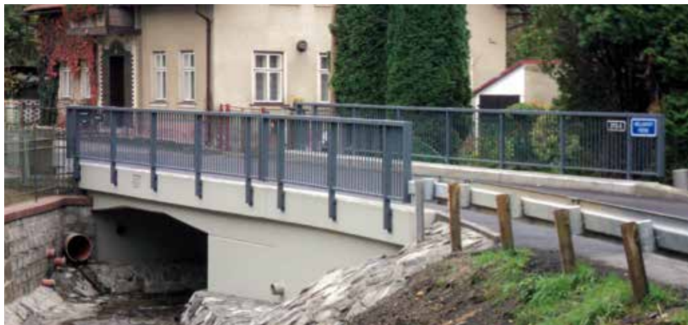
Přestavba mostu ev. č. 2713-5 v Chotyni přes Václavický potok

Další významnou zakázkou byla přestavba mostu ev. č. 2713-5 v Chotyni přes Václavický potok, která zahrnovala demolici stávajícího kamenného klenbového mostu a realizaci nového železobetonového rámového mostu, zadláždění koryta vodoteče, přeložku vodovodu a kabelu – Telefonica O2. Celoroční stavební práce probíhaly na zakázce: „Obnova silnice po povodních 2010–III/27252 Vítkov“, kde se podílíme zejména dodávkou staveb železobetonových propustků a kompletních vozovek s asfaltovým krytem, výstavbou komunikací pro pěší a autobusových zálivů. Rozsáhlou výstavbu komunikací pro pěší představovala zakázka: „Zajištění bezpečného