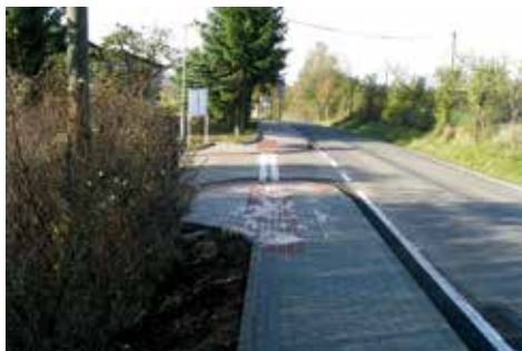
Vybudování přístupu k autobusovým zastávkám v Lestkově

lech a v Předměřicích. V děčínské společnosti pokračovali práce na kanalizaci a vodovodu v Krásné Lípě.