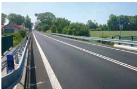
Silnice I/33 směr Předměřice